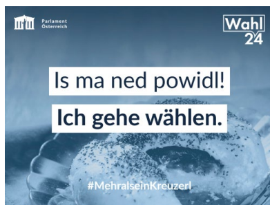
M1 Wahlauftritt des Parlaments 2024

Trotz der Möglichkeit eines permanenten Campaignings sind Wahlkämpfe noch immer wichtige Phasen politischer Kommunikation. Nicht zuletzt, weil derzeit populistische Parteien wichtige Garantien der Verfassung oder Grundrechtskataloge in Frage stellen und damit bei immer mehr Menschen Anklang finden (Frankreich, Sachsen, Thüringen). Dabei spielen Personalisierung und Emotionalisierung von Themen eine wichtige Rolle. Auch „Framing“ kommt zum Einsatz: Die eigenen Positionen werden positiv, die der Mitbewerber negativ „geframt“. Das fördert die Polarisierung.