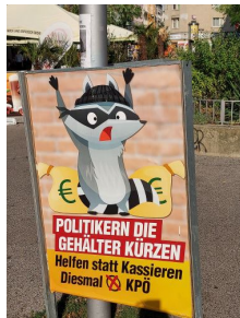
M2 Wahlplakate von Anfang September 2024 – Auswahl