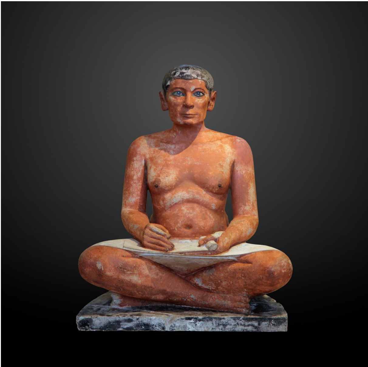
M3 Der sitzende Schreiber, Louvre, Paris, Fotografie, 2018