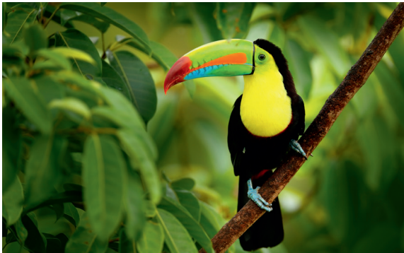
Abb. 1: Tukan